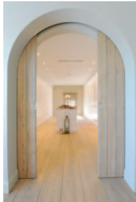
De inloopdeur naar de slaapkamer integreert volkomen in het maatwerk van de dressingkasten.

De ruime dressing en de slaapkamer gaan in elkaar op. In de boogvormige doorgang zit wel een dubbele schuifdeur verborgen, kwestie van de slaapkamer te kunnen afsluiten als je daar nood aan hebt. De slaapkamer met bekleed bed heeft stijl. Het hoofdbord is gecapitonneerd en de voet wordt bekroond met een footstool. Het zeteltje en de voetbank hebben dezelfde capitonnage. Gezeten heb je een fijn uitzicht op de achtertuin en het zwembad met poolhouse. Leuk gadget: een verrekijker op een ranke pikkel. Nicky herneemt de kleuren wit en greige in de raamdecoratie, kwestie van de harmonie te handhaven. Het bed is elektrisch regelbaar, zo is je nachtrust verzekerd. Beddensprei en gordijnen zijn royaal gedrapeerd tot op de vloer, wat mee zorgt voor een gevoel van optimale verwennerij. De handdoeken en de tapijtjes komen van Flamant.