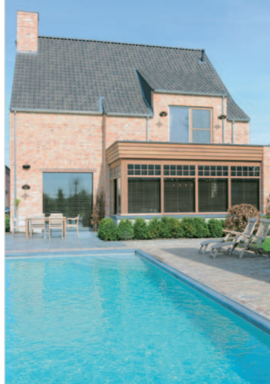
Het buitengebeuren past perfect bij het binnenhuisplaatje met herkenbare Nicky Goossens-stempel. Gerecupereerde baksteen in combinatie met zwart gepatineerde pannen van Koramic. Het schrijnwerk in alformosia zal metertijd mooi patineren.