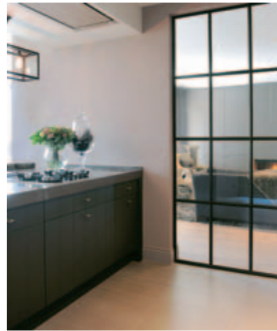
De knappe keuken in grijs en het intieme salon corresponderen speels via een gietijzeren binnenraam.

Zodra de eigenaars bezig waren met de plannen voor hun nieuwbouw hebben ze Nicky Goossens betrokken bij de besprekingen. Aldus werden de kleuren en materialen van bij het begin op elkaar afgestemd. Letterlijk een interieur op maat, zoveel is zeker. Met op het gelijkvloers plafonds van ruim drie meter hoog, zodat het ruimtegevoel gevrijwaard blijft. 'Boven het kookeiland hangt een strakke lamp die speciaal voor ons werd gemaakt. De stoelen bij de eettafel zijn twintig centimeter hoger dan standaard. Die extra hoofdsteun geeft je een royaal gevoel van comfort.' Keuken en eetkamer vormen een gedroomd geheel waar geleefd wordt. De geautomatiseerde lamellenstores, die de eetkamer afschermen voor inkijk, verzinken beeldig en onopvallend in een nis in het plafond. De gordijnen sluiten, zonder roede, naadloos aan bij het plafond. In de vitrinekast pronken siervoorwerpen: wereldbol, sextant, glaswerk, vazen en schalen. De ovale eettafel, in lichtjes vergrijsd hout, is liefst 3,50 meter lang. Perfect dus om veel gasten te ontvangen. 'Mijn echtgenoot verstaat de kunst om een heel menu klaar te stomen in een handomdraai. Wat een luxe!' Rank en imposant sieren twee vitrinekasten in donker hout