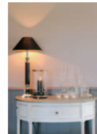
Het binnenraam wordt geflankeerd door schattige muurtafeltjes.

spreken van unieke grijstonen die het geheel warm, levendig en sober laten ogen. Moeilijk te definiëren toetsen waar enige variatie in zit, terwijl ze toch ton-sur-ton bij elkaar aansluiten. Hoge plinten versterken nog het rijkelijk elan dat uitgaat van de stoffering. Het huiskantoortje grenst aan het salon. Met twee windlichten op voet maak je de overstap. Je zit er afgescheiden en ook weer niet, dankzij de boogvorm. 'Wij wilden graag die bureaustoel behouden omdat het een familie-erfstuk is. Nicky heeft het frame laten zandstralen en herstofferen. Zo leidt het meubel nu een nieuw leven en past het in het geheel.' Algemeen valt de geordende schikking van de dingen op. 'Dat alles zijn vast plaatsje heeft en het aantal spullen goed overwogen werd, schenkt ons innerlijke rust. We hebben een gerieflijk huis dat ons ademruimte biedt, maar het is ook weer niet te groot, want we willen er niet de slaaf van zijn.' De kurk gaat van de fles rode Pauillac uit 2003, van Château Croizet-Bages. We klinken op een gezond en gelukkig leven in een interieur waar een positieve vibe van uitgaat. 'Dit concept is ons op het lijf geschreven. Nicky creëerde een woning die zit als een maatpak.'