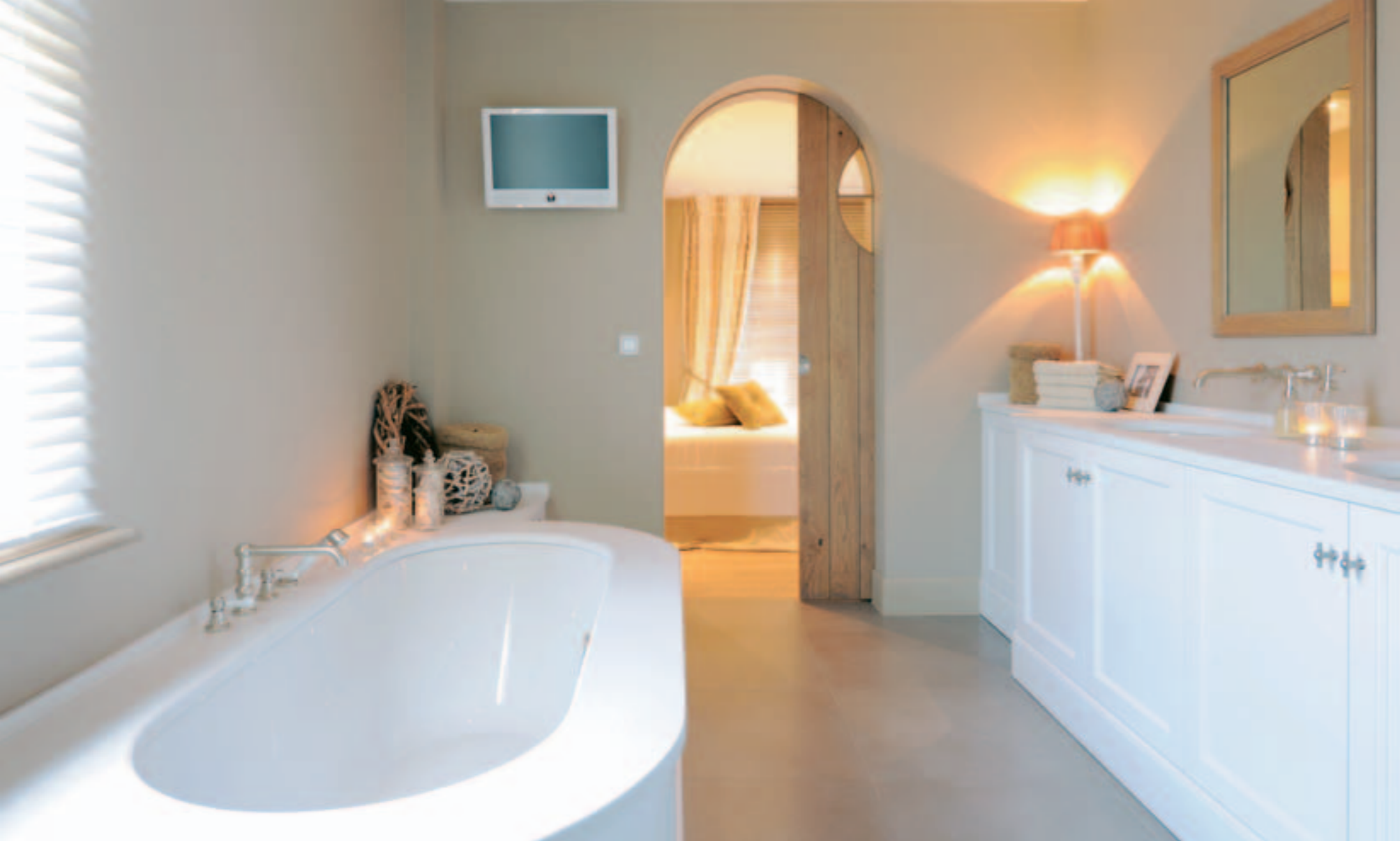
De badkamer baadt in warm wit en de betegeling accordeert uitstekend met het vergrijsde hout.