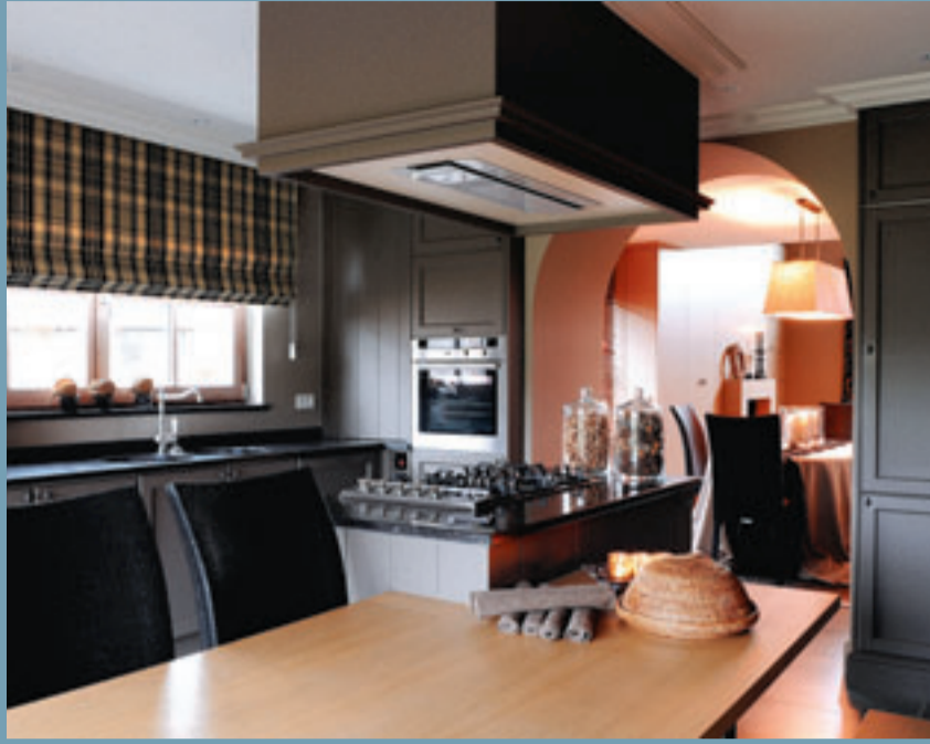
Een grote, dikke boog scheidt de eetkamer van de keuken.