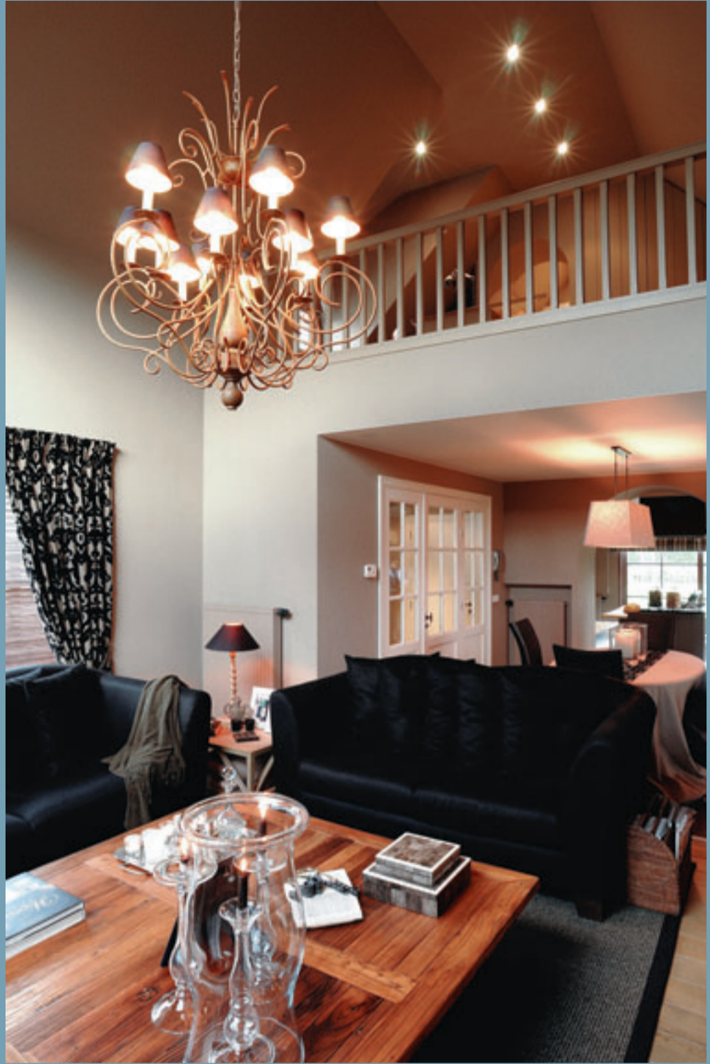
De zithoek ligt een trapje hoger, zodat je het huis goed kan overzien van in de zetel.