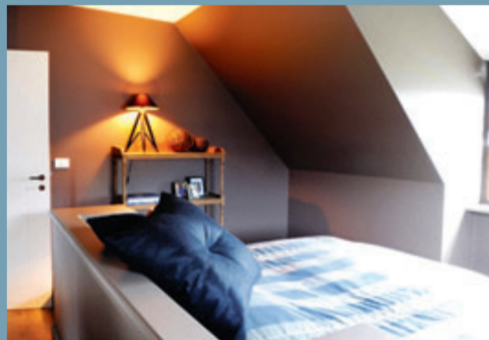
Van in het bed kan je naar buiten kijken. «Heerlijk, zo wakker worden met de zon op je gezicht.»