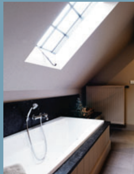
Het dakvenster in smeedijzer vormt een charmant accent.

De details maken het verschil. Zo zijn er in de badkamer ook hoekjes met accessoires. Dat maakt de badkamer evengoed tot een leefruimte. De spiegels boven de spoeltafel zijn de deuren van in de muur verzonken kasten. «We hebben geopteerd voor een dakvenster in smeedijzer. Best charmant. Het extra onderhoud, door de condensvorming, nemen we er graag bij.» De slaapkamer heeft gewatteerde gordijnen die royaal tot op de vloer zijn gedrapeerd. Sierlijk weggebonden ook, met koorden en kwasten. De bedsprei sluit naadloos aan bij de gordijnen. Plaats voor een dressing room was er niet, maar dit werd handig opgelost. «Ons bed staat op een trede die wat kleiner is dan de slaapkamer. Het bedhoofd gebruiken we als afscheiding. In het lager gelegen gangetje hebben we dan een wandvullende kleerkast gecreëerd. En zo hebben we dus een geïntegreerde dressing room. Dat ons bed uitkijkt op een raam, is zalig. Wij wor-