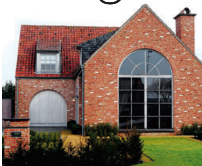
Een metershoog raam vooraan zorgt voor voldoende licht binnen.