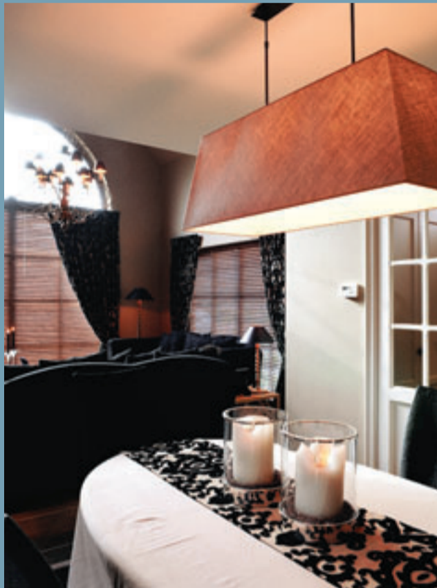
Het medaillon-motief van de gordijnen wordt hernomen in de tafellopers. Zo krijg je een gevoel van eenheid.