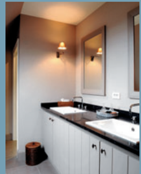
Deze spiegels zijn eigenlijk deurtjes van ingebouwde kasten.